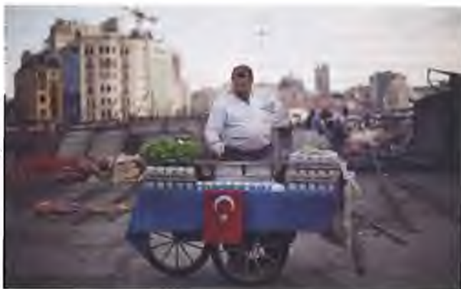
Un marchand ambulancier installé place Taksim, à Istanbul.

Je me lève le matin et je trouve un petit mot de ma compagne sur mon manuscrit, à l'endroit où j'en étais la veille. Elle part travailler vers huit heures et me laisse seul pour écrire. Quand elle revient le soir, la meilleure partie commence. Je lui lis ce que j'ai écrit dans la journée, guettant sur son visage, phrase après phrase, sa réaction. Puis nous regardons la BBC, les télévisions internationales, nous dinons et buvons du vin. C'est la journée idéale. ■