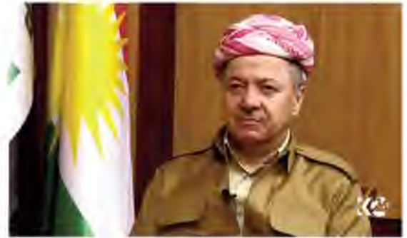
President of the Kurdistan Region Masoud Barzani during an interview.

“Subjects related to the sovereign state, such as the army, foreign and financial policies, would be based in Erbil, but for other affairs, local governments would administer themselves. We should not be thinking about a forceful central governing system, but rather, we have to be cooperative,” Barzani mentioned.