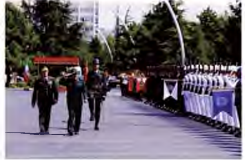
Chief of Staff for the Armed Forces of Iran Mohammad Bagheri (C) and Chief of the General Staff of the Turkish Armed Forces Hulusi Akar (L) visit Ankara this week

Turkey faces an intricate tangle of military and diplomatic challenges in Syria and Iraq, but things may finally be going its way in its war at home against the PKK