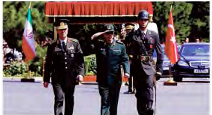
Chief of Staff for the Armed Forces of Iran Mohammad Bagheri (C) and Chief of the General Staff of the Turkish Armed Forces Hulusi Akar (L) visit Ankara this week

To Iran, ending the war in Syria needs Turkish assistance, given Ankara's