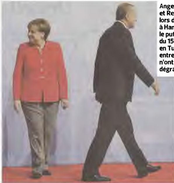
Angela Merkel et Recep Tayyip Erdogan, lors du G20, le 7 juillet à Hambourg. Depuis le putsch manqué du 15 juillet 2016 en Turquie, les relations entre Berlin et Ankara n'ont fait que se dégrader.

Ankara reproche aussi à l'Allemagne d'avoir pris parti pour le non au référendum du 16 avril sur l'extension des pouvoirs du président Erdogan. En juin, la Turquie a interdit à des parlementaires allemands de se rendre à Incirlik, pour