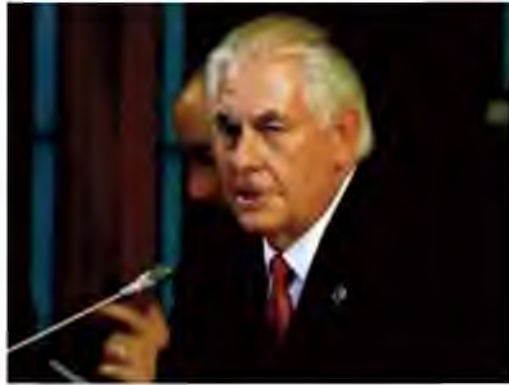
FILE PHOTO - U.S. State Secretary Rex Tillerson gives an opening statement during the ASEAN-U.S. Ministerial meeting of the 50th Association of Southeast Asia Nations (ASEAN) Regional Forum (ARF) in Manila, Philippines August 6, 2017.

Barzani, whose father led struggles against Baghdad in the 1960s and 1970s, told Reuters in July the Kurds would take responsibility for the