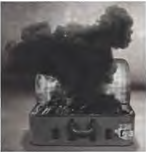
↑ Photomontage de Tammam Azzam, Syrie.