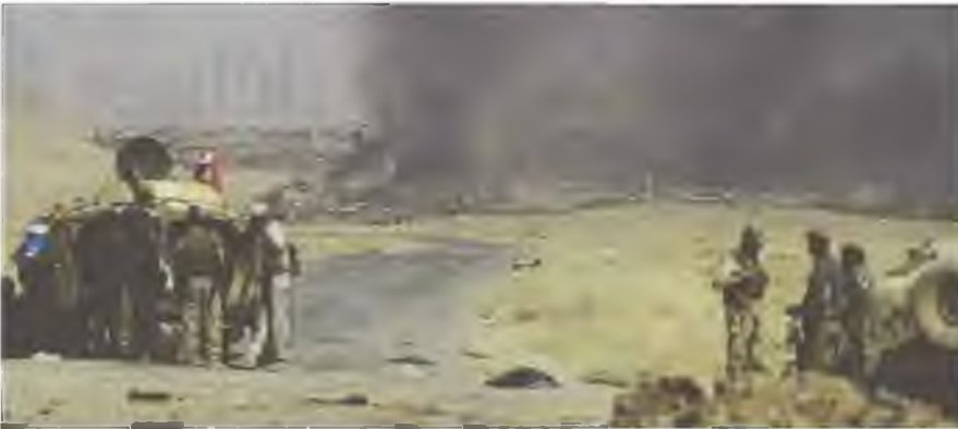
Des soldats de l'armée irakienne prennent position devant la ville de Tall Afar, lundi.

Les djihadistes ne contrôlent plus que trois autres villes près de la frontière syrienne et une dernière, au sud de Mossoul.