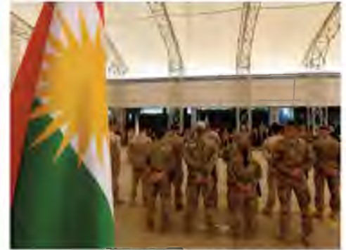
Military advisers from the international coalition forces stand during a transfer of authority ceremony on 15 June 2017 at the Kurdistan Training Coordination Center (KTTC) of Erbil, the capital of the autonomous Kurdish region of northern Iraq.

The US is also concerned about Turkey's oppo-