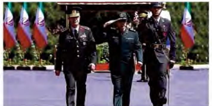
Le chef d'état-major de l'armée iranienne, le général Mohammad Baqeri, est arrivé, le 15 août 2017, à Ankara, en Turquie.