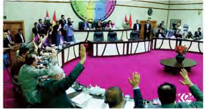
Kirkuk Provincial Council (KPC) held a special session on joining the Kurdistan Region independence referendum scheduled for Sep. 25, 2017.

Bagdad juge le référendum sur l'indépendance kurde contraire à la Constitution irakienne. Etats-Unis et pays occidentaux redoutent que ce