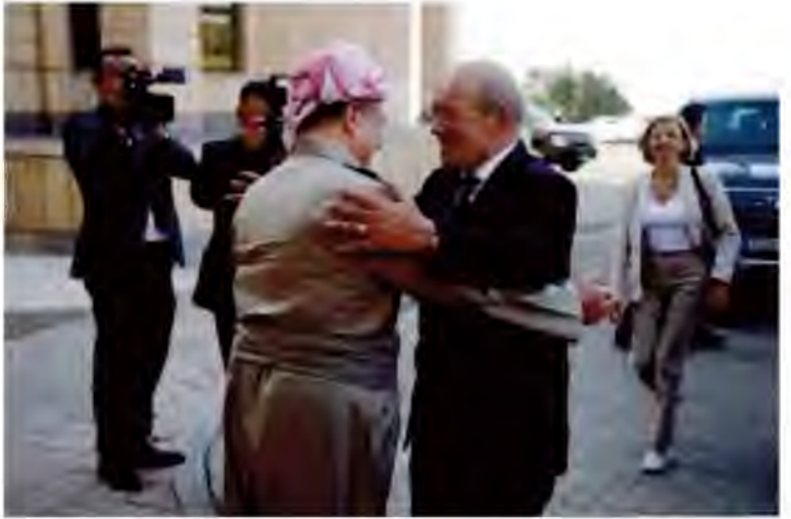
Iraq's Kurdistan region's President Massoud Barzani receives French Foreign Minister Jean-Yves le Drian and French Defence Minister Florence Parly in Erbil, Iraq, August 26, 2017.

Later on Saturday, the French ministers met Kurdish President Masoud Barzani in Erbil, the capital of the autonomous Kurdistan region, whose Peshmerga fighters have played a prominent role in the fight against Islamic State.