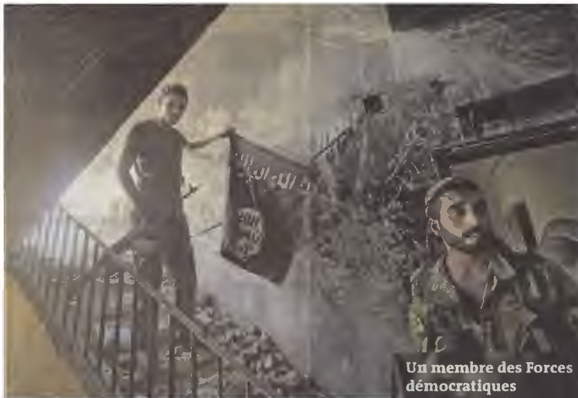
Un membre des Forces démocratiques syriennes retire un drapeau de l'EI, à Rakka, le 14 août.

Les Kurdes, qui dominent les Forces démocratiques syriennes, veulent s'assurer que les institutions seront conformes à leurs intérêts après la bataille