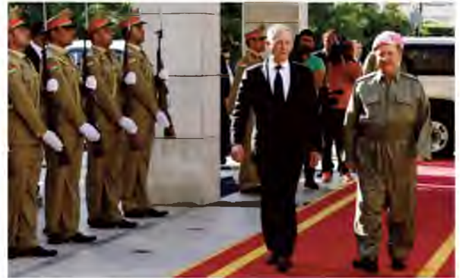
Massoud Barzani and Mattis Iraq's Kurdistan region president Massoud Barzani (R) receives U.S. Defense Secretary James Mattis on August 22, 2017 in Erbil, the capital of the Kurdish autonomous region in northern Iraq.

September 25 vote, or a referendum at a later stage when it has greater political support from allies, say officials.