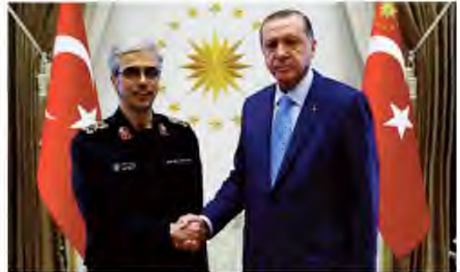
President of Turkey Recep Tayyip Erdogan (R) shakes hands with General Staff of the Armed Forces of Iran, Mohammad Bagheri (L) ahead of their meeting at Presidential Complex in Ankara, Turkey on August 16, 2017.

VOA described the top Iranian general's visit to Ankara as "rare," noting: "The two neighbors have found themselves increasing rivals in Iraq and Syria, but both sides are trying to find common ground."