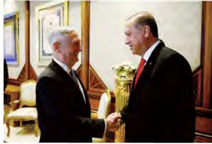
Turkish President Tayyip Erdogan meets with U.S. Defense Secretary Jim Mattis at the Presidential Palace in Ankara, Turkey, August 23, 2017.

The Turkish and American sides also repor-