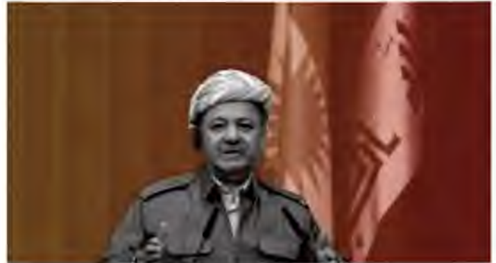
The president of Iraq's Kurdistan Region, Massoud Barzani, speaks during a joint news conference with German Foreign Minister Sigmar Gabriel (not pictured) in Erbil, Iraq, April 20, 2017.

The visit of the Kurdish delegation to Baghdad did not include members of the Patriotic Union of Kurdistan, the Movement for Change (also known as Gorran) and the Kurdistan Islamic Union. All the Iraqi figures who met with the delegation advised postponing the referendum and warned against secession. Also, the Iraq's supreme Shiite authority, Ali Sistani, refused to host the delegation in the province of Najaf as had