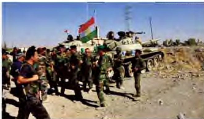
Rudaw file photo of Peshmerga soldiers in their fight against ISIS.

The two sides "stressed that if the referendum is held, it will become the basis for a series of tensions and