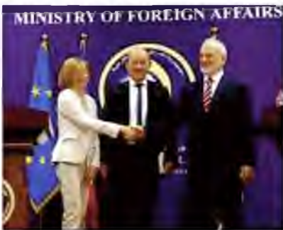
Iraqi Foreign Minister Ibrahim al-Jaafari, right, welcomes French Defence Minister Florence Parly, left, and French Foreign Affairs Minister Jean-Yves Le Drian, at a press conference in Baghdad, Iraq, Saturday, Aug. 26, 2017.

In Baghdad, the French ministers and Jaafari did not mention the fate of families of French citizens who fought with Islamic State, found in Mosul and other areas taken back from the militants. Several hundreds French nationals are believed to have joined the group. ●