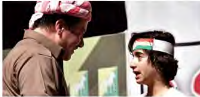
Kurdish President Masoud Barzani earlier this month declined a request from the United States to postpone the independence referendum set for September 25. He told US Secretary of State Rex Tillerson that they failed to provide an alternative.

On Thursday, a Kurdish source with knowledge of the negotiations and who asked not to be named, told Rudaw that there is "a small chance" that the Kurdistan Region would agree