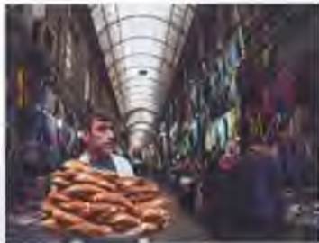
Un vendeur de rue avec son plateau de "simit", petits pains briochés turcs traditionnels.

Absolument pas. J'ai été élevé en appartement, passant le plus clair de mon temps à l'intérieur, dans un décor constitué de vieux meubles à la fois européens et ottomans. Plusieurs de mes oncles maternels et paternels, qui dirigeaient des magazines et des journaux, écrivaient des tribunes sérieuses et parlaient politique à la maison.