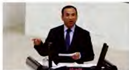
Turkish Deputy Prime Minister Bekir Bozdag.

Turkey is directly concerned with the developments and unrest behind its southern border, and no one should expect it to ignore what is happening in its