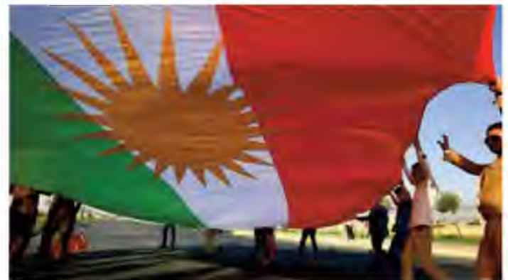
Les droits des Kurdes sont brimés ou sévèrement limités dans les pays où ils sont dispersés : Turquie, Irak, Iran et Syrie.

qui a été négocié avec les militants kurdes du PKK en mars 2013 a été abrogé par le président Erdogan deux ans plus tard afin de s'attirer le vote de nationalistes turcs. Ce faisant, l'Est de la Turquie est devenu une zone de combat et près de 500 000 Kurdes qui sont citoyens turcs vivent en réfugiés dans une zone de destruction massive. 13 députés kurdes au parlement turc ont été emprisonnés. Près de 45 000 enseignants kurdes ont été limogés ou suspendus par le gouvernement turc qui a décrété l'État d'urgence depuis le putsch raté du 15 juillet 2016. Pour sa part, l'Iran n'est pas intéressé par un état kurde, mais aimerait bien que le Kurdistan irakien soit sous sa zone d'influence à l'intérieur d'un Irak contrôlé par des Chiites de façon à contenir la Turquie. Les Kurdes de Syrie qui combattent l'État islamique doivent tenir compte de ce que l'armée turque est prête à leur tirer dans le dos ou encore à faciliter la prise de positions par des milices islamistes qui leur sont opposées. Un référendum en vue