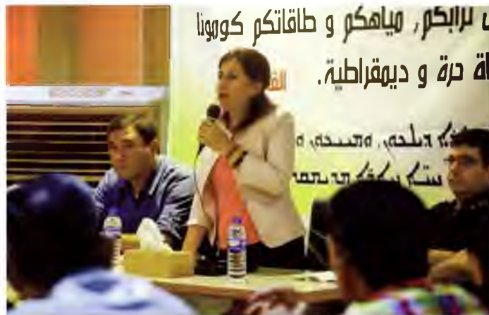
Hadiya Youssef, co-présidente de l'assemblée constituante du système fédéral.

La première phase aura lieu le 22 septembre, selon Mme Youssef, et verra les habitants voter pour des représentants au niveau de leur quartier. Les élections pour les conseils exécutifs des villes et régions se tiendront le 3 novembre. Enfin, le 19 janvier 2018, les habitants éliront des conseils législatifs pour chacun des