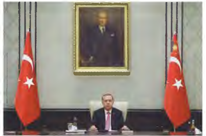
Le chef d'Etat turc Recep Tayyip Erdogan dans le palais présidentiel, à Ankara (juillet 2016).

Je le remercierais pour son coup de fil d'il y a onze ans. J'ajouterais que le pays ne semble plus aussi libéral, ouvert, européen et engageant qu'il l'était dans ses premières années au pouvoir. Je lui dirais que mes amis écrivains, professeurs, peintres, qui n'ont jamais été particulièrement concernés par la politique, en parlent maintenant sans cesse, évoquant notamment ceux qui ont été brutalement jetés en prison, sans preuve, arbitrairement, comme seule une société fermée et autoritaire le permet. Je mentionnerais certains écrivains que le public turc lit