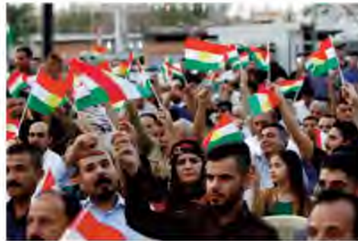
Kurdish people gather this month in Kirkuk, Iraq, in support of a referendum on the secession of northern Iraq's Kurdish region to be held on Sept. 25.

What Iraqi Kurds therefore need is a vote that empowers the Kurdistan Regional Government (KRG), Iraq's autonomous Kurdish administration, to negotiate independence. A legally valid referendum is a powerful expression of the popular will — when it has a specific mandate. However, the Sept. 25 referendum lacks this legitimacy, making its impact unclear. Nor will the result force any part of the KRG to act — not the president, the cabinet or the parliament.