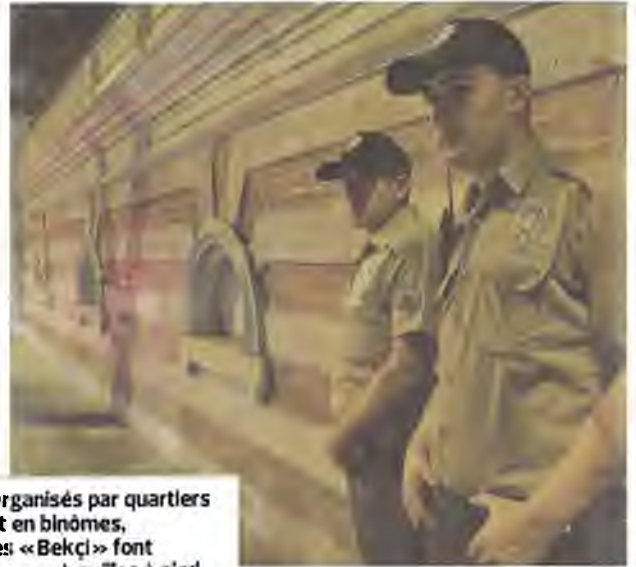
Organisés par quartiers et en binômes, les « Bekçi » font leurs patrouilles à pied de 22 heures à 6 heures du matin et sont, pour la plupart, équipés de menottes et de pistolets. LE FIGARO

Un peu plus loin, les deux policiers noctambules croisent un jeune couple qui se tient par la main. Il porte un piercing à l'oreille gauche. Elle est légèrement vêtue d'un débardeur. Cette fois-ci, les « Bekçi » passent leur chemin sans broncher. Mais la jeune femme retient son souffle. « Ce sont des agents de l'AKP! Rien que leur présence dans les rues me rend mal à l'aise. Sincèrement, j'ai l'impression qu'ils sont là pour m'embêter, pas pour me protéger », dit-elle. Sous la nouvelle lune d'Istanbul, la nuit s'annonce longue et escarpée. ■