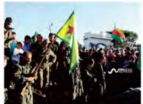
Kurdish fighters of the YPG [leading SDF member] in Afrin bid farewell to comrades killed during clashes against ISIS.

“We will not leave the separatist organization in peace in both Iraq and Syria,” Erdogan said, in reference to the YPG. ●