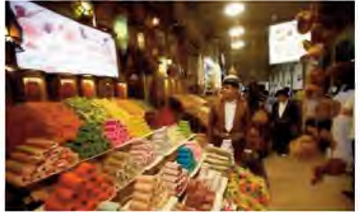
A Kurdish man sells sweets at a market in Erbil, Iraq, August 17, 2017.

The Kurds say they need the extra revenue to cope with increased costs incurred by the war against Islamic State and a large influx into KRG territory of displaced people.