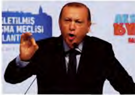
Le président turc Recep Tayyip Erdogan durant un meeting de son parti, l'AKP, au pouvoir, à Istanbul, le 20 août 2017.

La Turquie est en conflit sur son sol avec la guérilla kurde du PKK. Ce mouvement possède une branche en Iran, le PJAK. Et des combattants de ces deux organisations disposent de bases arrières au Kurdistan irakien. Désormais, le président turc Erdogan n'hésite pas à parler « d'opéra-