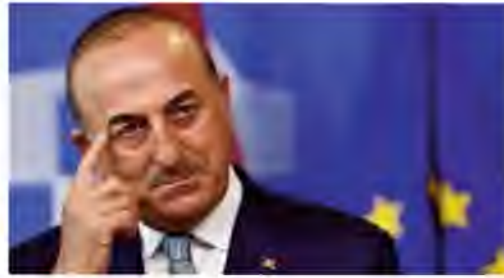
Turkish Foreign Minister Mevlut Cavusoglu gestures during a news conference at the European Commission in Brussels, Belgium, July 25, 2017.

The independence referendum, Washington's argument goes, would weaken Iraq's moderate Prime Minister Haider al-Abadi before his pro-Iranian rivals. It would also disrupt the US-led campaign against the Islamic State. The Iraqi Kurds dismiss such concerns, saying the referendum will not lead to independence overnight. The Iraqi Kurdish peshmerga will con-