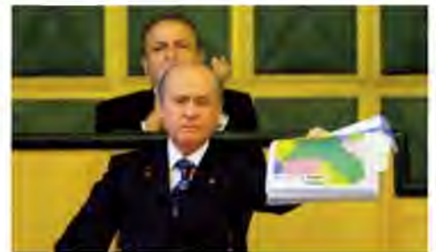
Devlet Bahçeli, the leader of the Turkish far-right Nationalist Movement Party (MHP), displays a map of the Greater Kurdistan during a speech in criticism of the government to his lawmakers, Oct. 14, 2008.

Kurdistan's President Masoud Barzani stated there would be no postponement, saying