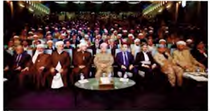
Iraq's Kurdistan Region President Massoud Barzani (C) sits during his meetings with clerics and elders from the cities of the Kurdistan Region in Erbil, Iraq, Aug. 9, 2017.

While originally envisaged as a means to maximize leverage in negotia-