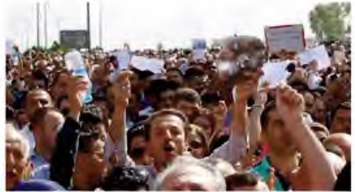
Protesters, most of them schoolteachers, demonstrate against the Kurdistan Regional Government for delays in paying their salaries, Sulaimaniyah province, Iraqi Kurdistan, Sept. 27, 2016.

"I will go to the polls, and I will mark a resolute no," said Nesar, a primary schoolteacher from Halabja who has taught for 18 years. "The government has slashed my salary of $900 by 65%." When Al-Monitor asked