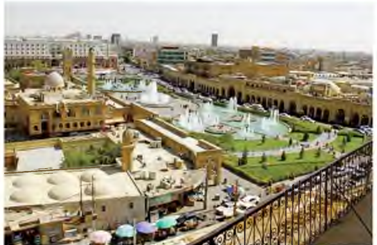
The Kurdish capital of Erbil.

Still, the KRG is working to lessen dependency on oil—which only employs one percent of workers—and to enact austerity measures for the