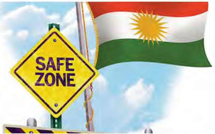
Sovereign Kurdish Territory Illustration by Greg Groesch/The Washington Times

Mr. Trump’s proposed safe zone in Syria is not merely realpolitik but is the preferred policy of those I’ve spoken to in the camps — they want to go home. That safe zone should include those areas of Northern Iraq adjacent to Syria that are home to the victims of the ISIS genocide. Those areas also border Iraqi Kurdistan, which has offered refuge to so many displaced by ISIS.