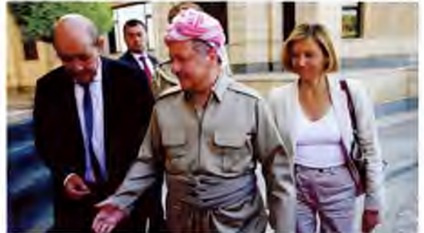
Les ministres Jean-Yves Le Drian (Affaires étrangères) et Florence Parly (Armées) ont été reçus par Massoud Barzani, le président du gouvernement régional du Kurdistan, le 26 août à Erbil.

Pour l'instant, les Kurdes ne semblent pas vouloir obtempérer, faute d'assurances fortes de la part des Occidentaux concernant leur aspiration à l'indépendance. Ils ont un atout majeur, qu'ils viennent de gagner par les armes, la reconnaissance de leur engagement du côté de la coalition internationale contre les jihadistes de l'Etat islamique, notamment pour la