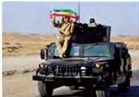
A KURDISH Peshmerga soldier holds a Kurdistan flag during an intensive security deployment after clashes with Islamic State militants..

Netanyahu expressed to the group his "positive attitude" toward a Kurdish state, saying that the Kurds are a "brave, pro-Western people who share