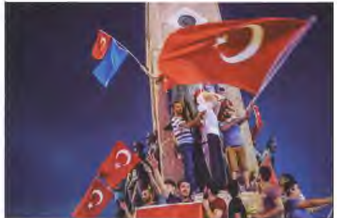
Des Stambouliotes manifestent leur soutien à Erdogan place Taksim, le 18 juillet 2016, deux jours après la tentative de coup d'Etat militaire.