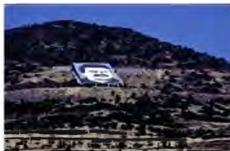
A portrait of jailed PKK leader Abdullah Ocalan in hills around Afrin

Nonetheless, when Erdogan says Turkey will do something, it usually happens. Some months back, he warned the Syrian Kurds in the words of an old song that Turkey's forces "might come suddenly one night". If a full-scale incursion cannot get a green light from the other powers in Syria, then the alternative may be to step up gradually escalating cross-border attacks while ensuring that no →