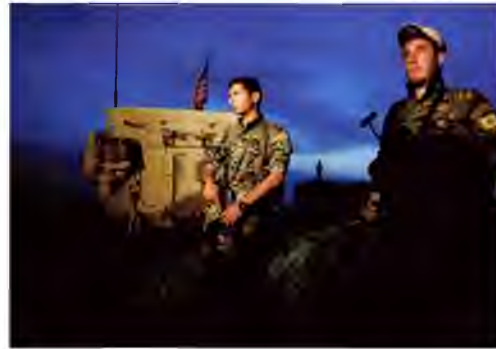
Kurdish fighters from the People's Protection Units stand next to a US military vehicle in the Syrian town of Darbasiya, close to the Turkish border, April 28, 2017.

According to a decision made at the Rmelan meeting, there will be communal elections Sept. 22, followed by cantonal and municipal elections Nov. 3 and elections for the People's Assembly of the Federal Regions and the Democratic Federal System of Northern Syria People's Congress on Jan.