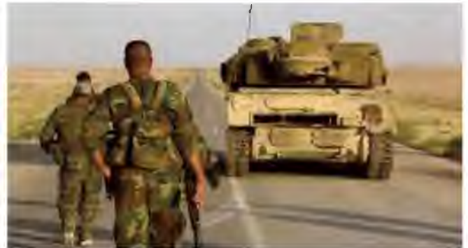
Syrian government forces secure a road for a military convoy in the desert area of Saba Biyar as fierce clashes are reported in southeastern Syria near the border with Iraq, May 10, 2017.