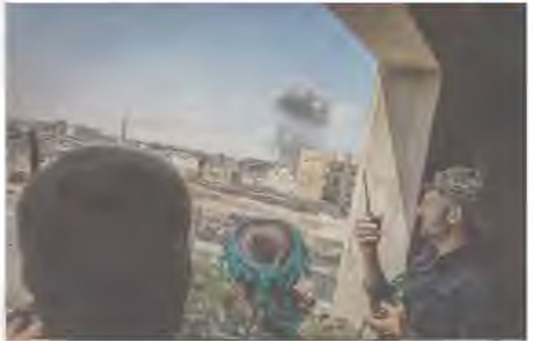
Les Forces démocratiques syriennes poursuivent l'assaut lancé en juin à Rakka, principal bastion de Daech en Syrie.

Jusqu'à quand la Turquie se retiendra-t-elle? L'indispensable protection américaine ne revient pas à une garantie à vie pour les FDS. « Les Kurdes savent qu'une fois Rakka tombé, ils seront moins utiles aux États-Unis », explique Fabrice Balanche. Un lâchage de