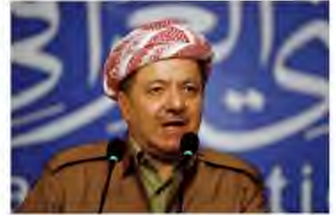
FILE PHOTO: Iraqi Kurdish regional President Masoud Barzani speaks during news conference with Ammar al-Hakim, leader of the Islamic Supreme Council of Iraq (ISCI), in Baghdad, Iraq, September 29, 2016.